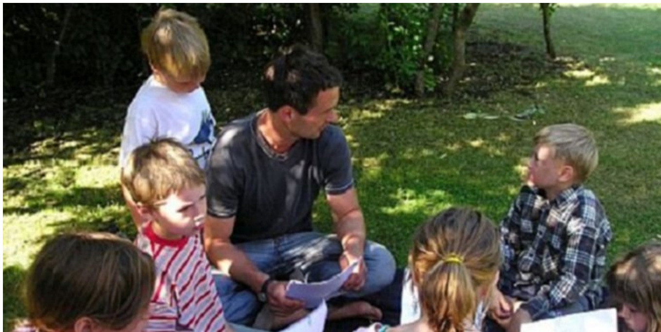
Aktionsprogramm Kindertagespflege (ausgelaufen am 31.12.2018)