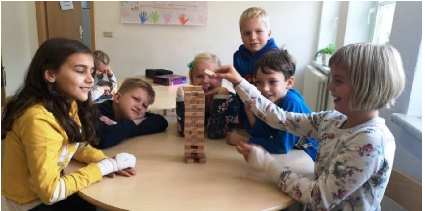
Projekt der Kindertagesbetreuung