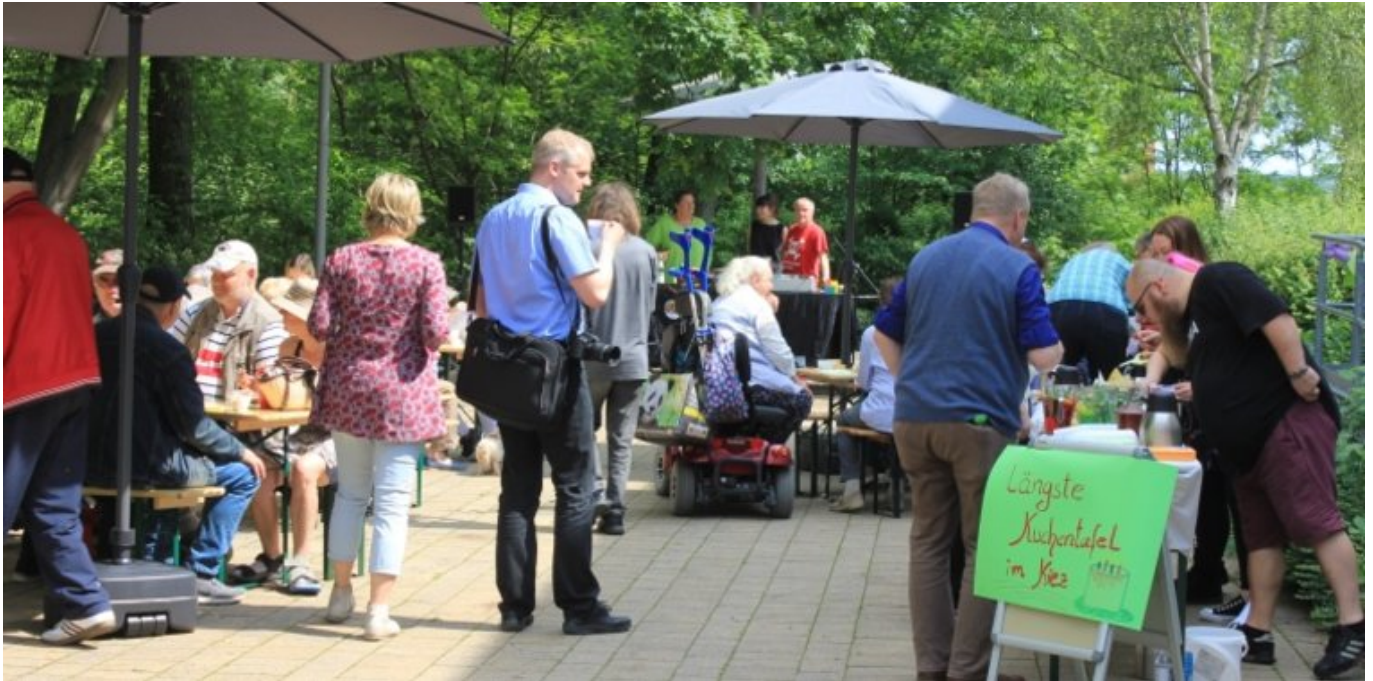
Quartiersmanagement Frankfurt (Oder) "Innenstadt - Beresinchen"