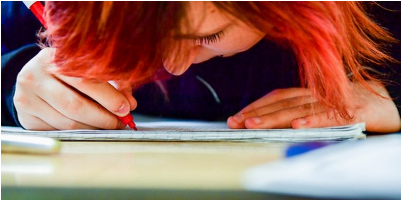
JUGEND STÄRKEN im Quartier, Potsdam