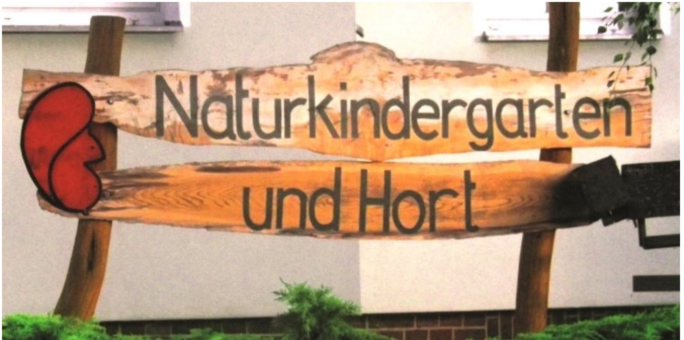
Naturkindergarten und Hort „Eichhörnchen“