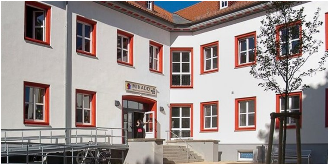
MehrGenerationenHaus MIKADO mit Familienzentrum